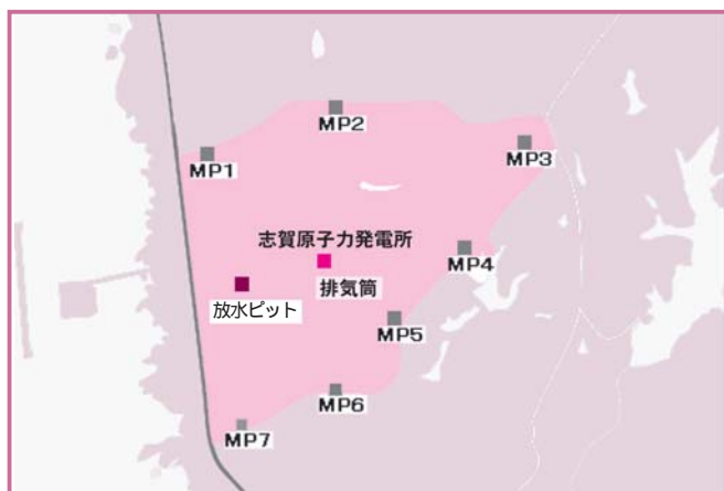
(MPはモニタリングポストの略)