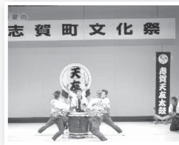
【昨年度の初夏の文化祭】

ところ 富来活性化センター 【ステーション】 14日(日)のみ 【各種展示】 13日(土)・14日(日)