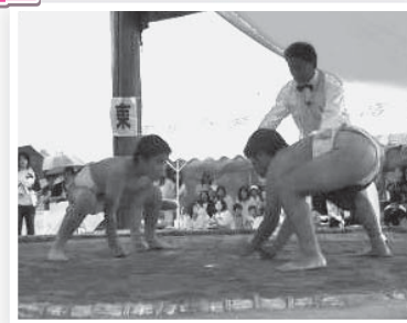
【昨年度子供会相撲大会】