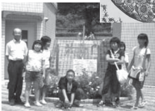
【昨年度の 見学研修】