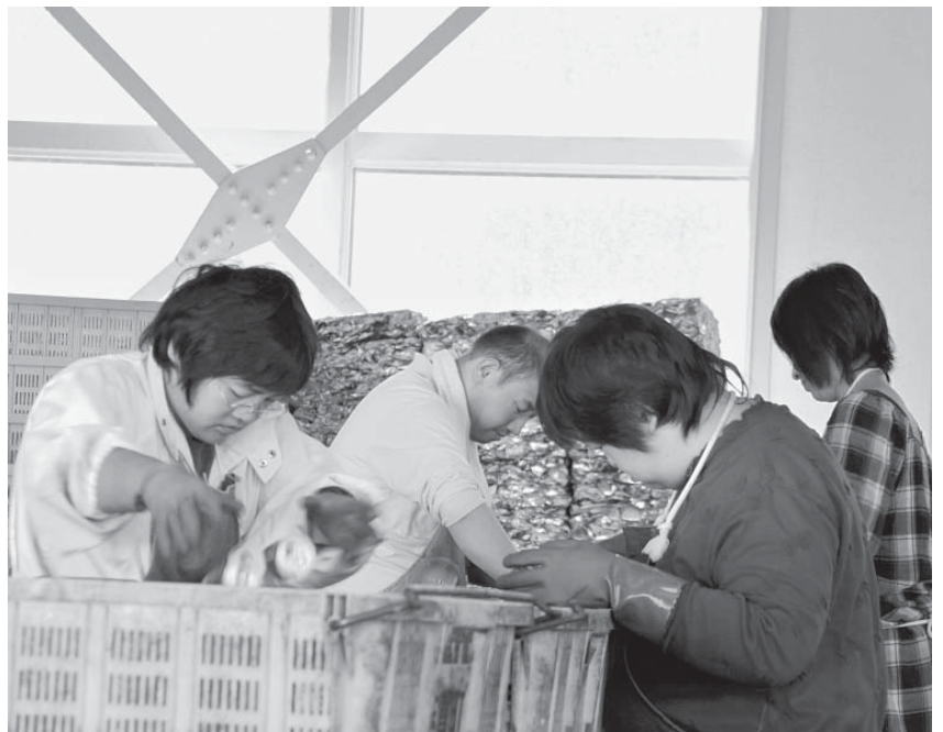
驚くほど早く仕分ける通所生たち。あっという間に一籠を終わらせてしまう