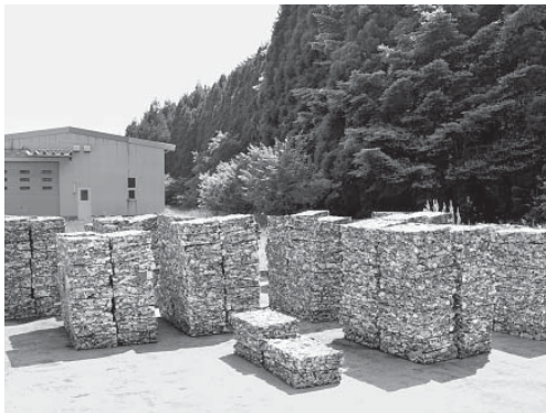
これだけ集めてもわずかな金額にしかない

通所生と職員がほとんど休まず作業する。1日に千箱以上を組み立てる。座っての手作業のため、肩こりがひどい。それでも、作業