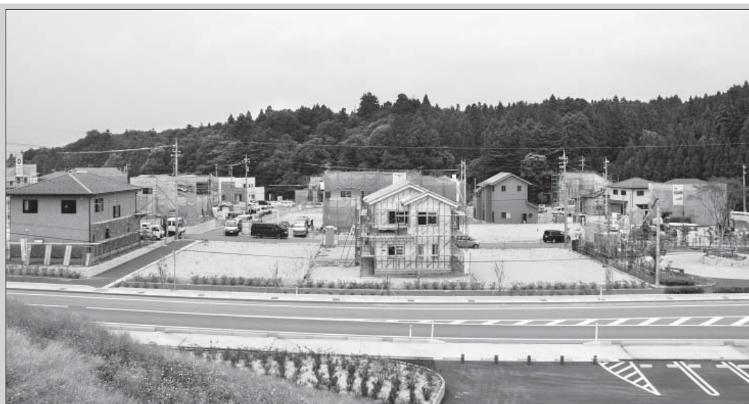
第2工区北側から見た第1工区の様子