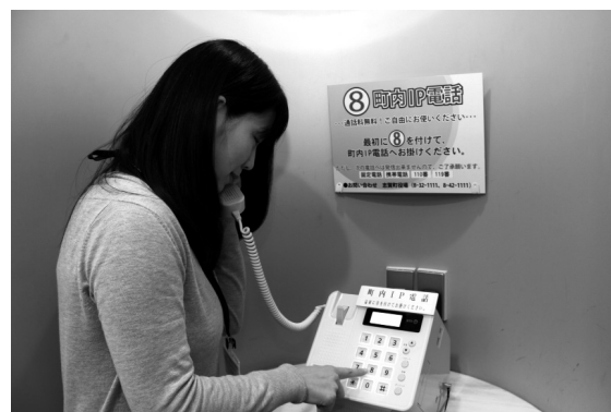
役場に設置された町内IP電話を利用する人