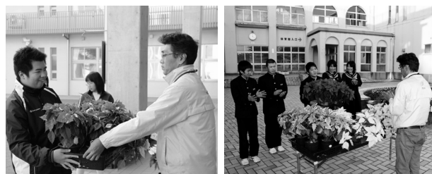
フローリィの館長から花を贈られる両校の生徒たち

ポインセチアはクリスマスを彩る代表的な植物とされ、生徒たちは寄贈された花を玄関に並べました。