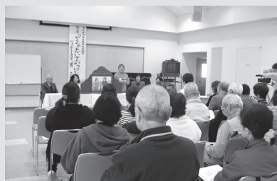
前回の出前講座の様子