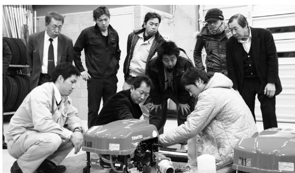
新型の小型ポンプの操作方法を教わるみなさん