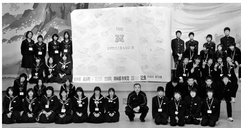
完成した友好旗と一緒に記念撮影。 「Friends 翼 はばたけ！みんなの絆」も輝いています。