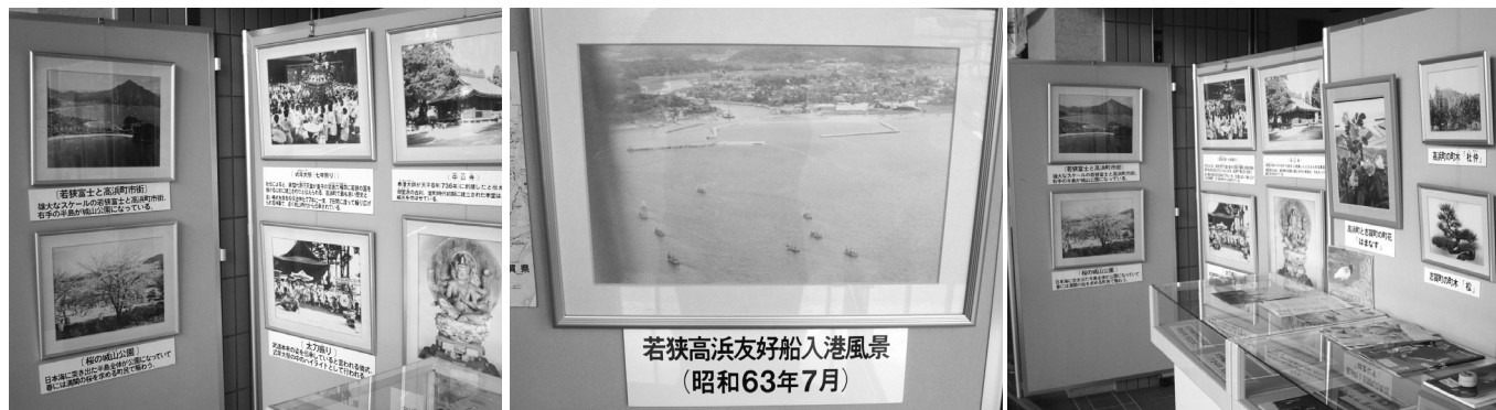
※志賀町役場本庁ロビーに姉妹都市交流の展示があります。

福井県高浜町と志賀町とは毎年姉妹都市交流を行っています。今年度は、姉妹都市提携調印式典を行って20年の節目の年。この交流事業を両町皆さんに親しみのもてる事業にしていきたいと考え、友好のシンボルである「友好旗」を両町の中学生にデザインしてもらい、作成しました。