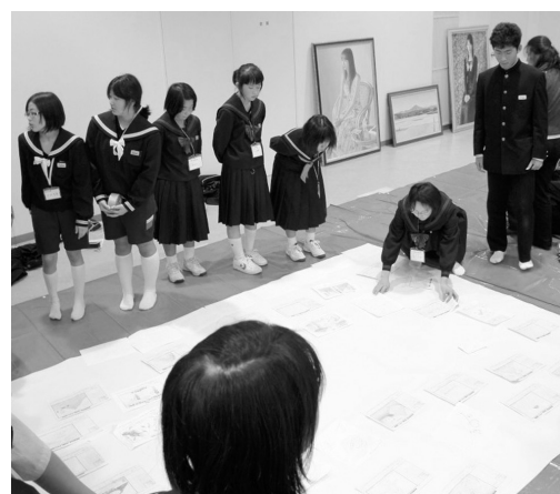
みんなでデザイン画の位置を確認しました。