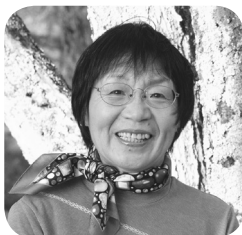
登山家 田部井 淳子 さん