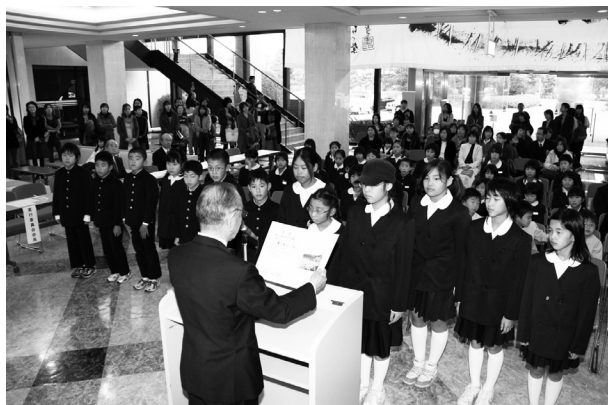
大賞を受賞した加茂小学校のみなさん