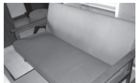
物品 40 椅子①