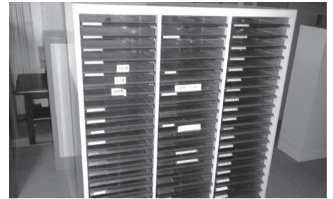
物品 27 スチール製トレイ付キャビネット小②