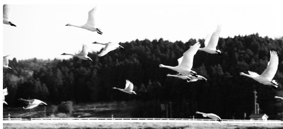
白鳥たちが福野潟から飛び立つ様子