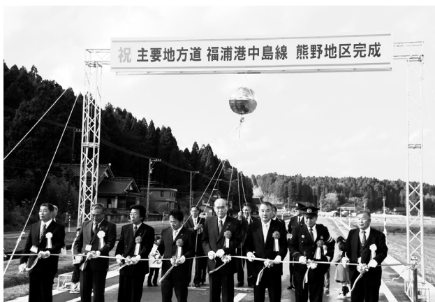
完成した福浦港中島線のテープカットをする様子