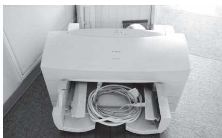
物品 57 インクジェットプリンター

ここに掲載された品物は、今回売り払われるもののほんの一部です。このほかにもさまざまな品物がありますので、下見会で実際に確認してください。