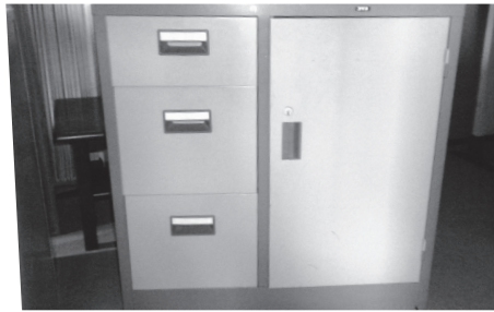
物品 21 スチール製キャビネット小④