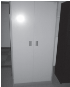
物品 15 スチール製キャビネット大⑥