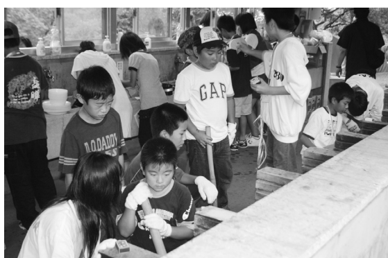
平成20年交流事業の様子 ※2泊3日、高浜町リーダーズクラブのみなさんにお世話になりながら、仲間と協力してどんなことにもチャレンジし、大きく成長した高浜小学校のみなさん。