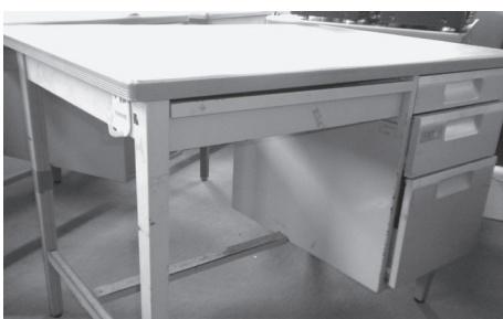
物品 30～37 スチール製テーブル