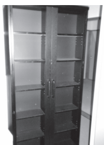
物品 53 木製本棚