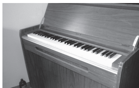
物品 38 オルガン