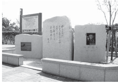
【坪野哲久文学碑】 高浜町 千鳥ヶ浜休憩所