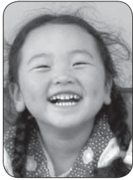
給分 太磨舞優ちゃん