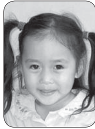
牛ヶ首 障子口望花ちゃん