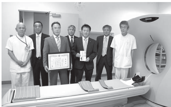
マルチスライスCTを囲む関係者

J A 共済が取り組む地域貢献活動「地域の安全・安心プロジェクト」の一環で、富来病院において導入したマルチスライスコンピュータ断層撮影（CT）装置の設置費用の一部が J A 志賀から寄附されました。