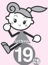
マスケットキャラクター 「いくちゃん」

そして、子育てを一人で悩まず、頑張らず、上手に周囲の協力を得ながら、ゆったりとした気持ちでやっていきましょう。