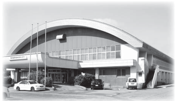
富来勤労者体育センター