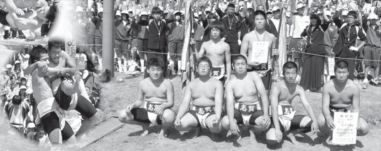
団体の部に優勝した志賀中学校の選手たち