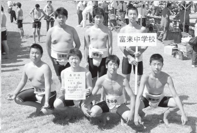
団体の部で3位を獲得した富来中学校の選手たち