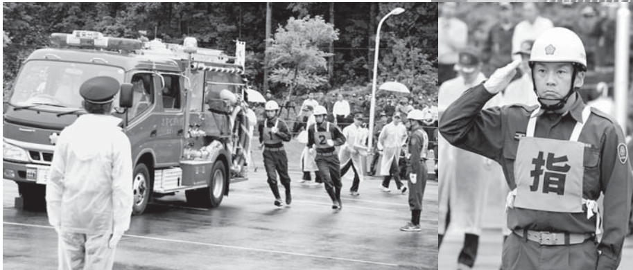
総合の部、ポンプ車操法の部2位の富来分団