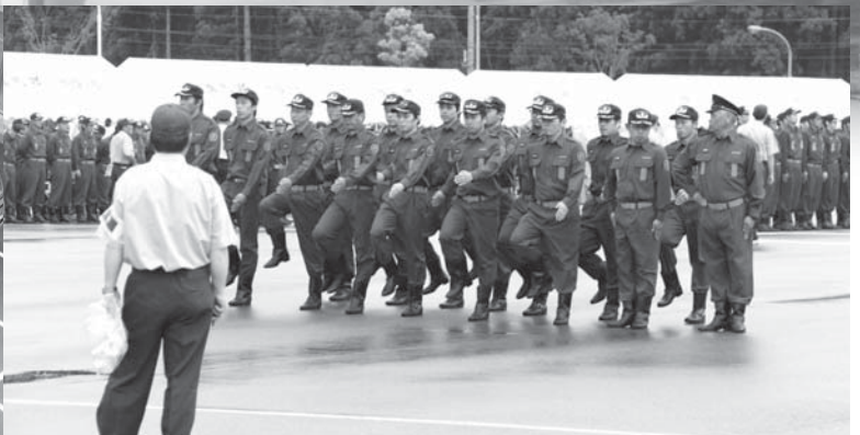
指揮者の号令で規律を守りながら行進する小隊訓練