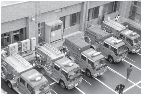
会場には27台のポンプ車が集まる