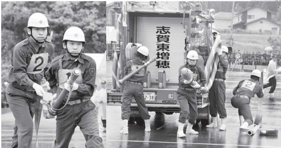
総合の部、ポンプ車操法の部1位の東増穂分団