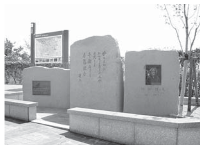
【坪野哲久文学碑】 高浜町 千鳥ヶ浜休憩所

住所、自宅電話番号、学校名、学年を明記の上、直接応募先まで持参または郵送してください。