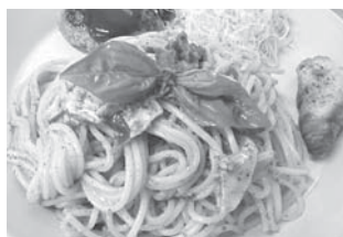
★ジェノベーゼ パスタランチ ドリンク付 1,000円(税込)