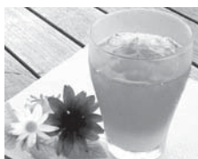
★オレンジ&ローズヒップの ビタミンジュース 400円(税込)