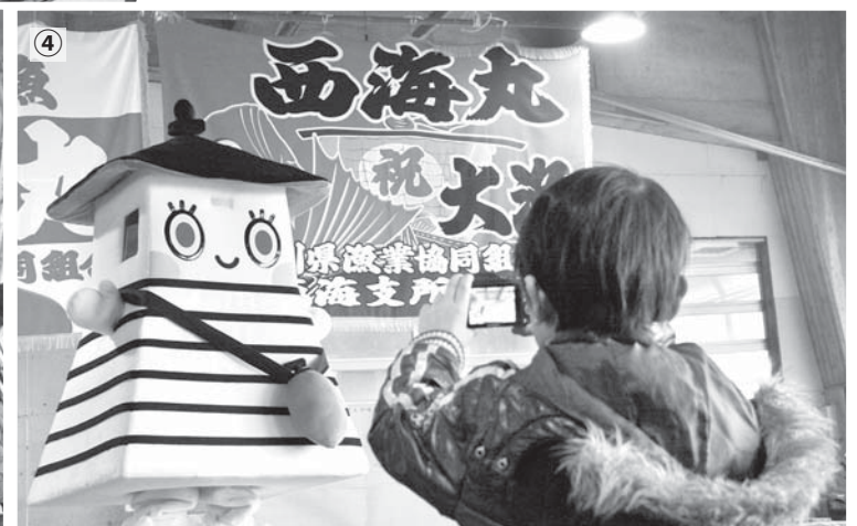
①冬の味覚の王様「加能ガニ」を買い求める来場者②会場で買った魚介類を食べる炉端焼きコーナーは満席に③福引大抽選会では、20尾入りの甘エビが300箱用意された④初お披露目のあかりちゃん登場に、多くの人が注目した⑤甘エビや加能ガニ、タラとエビのつみれやアカイカなど海の幸が詰まった大漁鍋に多くの人が体を温めた

「大漁鍋」コーナーでは、朝から長蛇の列ができ、2,500食が完売。買った魚介類をその場で焼いて食べる炉端焼きコーナーでは、カキやホタテなどの焼きたてを味わう家族連れで賑わい、昨年より増設した炉端も満席になるなど大盛況でした。