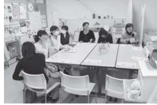
②特別教室部会（保健担当が金沢市の戸板小学校で研修）