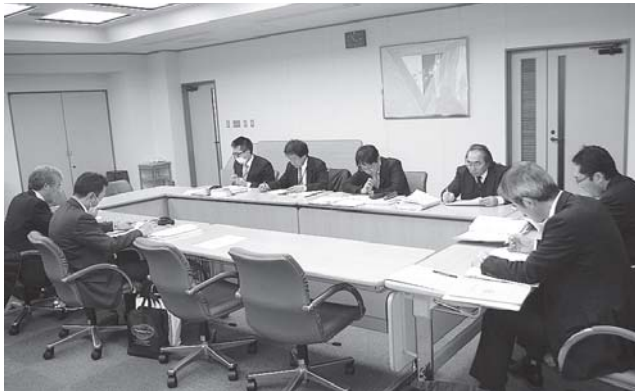
①学校管理運営部会（平成 27 年 2 月）