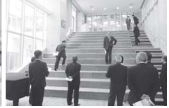
③建設検討委員会で野々市小学校を視察（平成 25 年 2 月）

当委員会は、町議会議員、PTA代表、地区代表など13人の委員が在籍し、さらに詳細事項を検討するため、7部門の開校準備部会が併設されています。