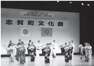
▲会場を盛り上げたアトラクション