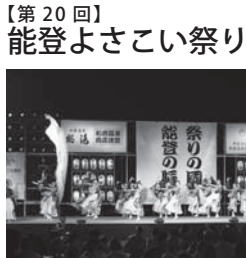
能登よさこい祭り