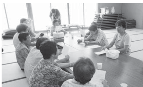
栄養士からの作り方アドバイス

まだ始まったばかりで すが、たくさんの方が参 加し、皆さん笑顔で元氣 に身体を動かしている姿 が印象的でした。