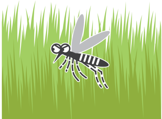
風通しの悪い やぶ・草むら

公園、学校、寺社、空海港、駅などの施設を管理されている方もご協力をお願いします!