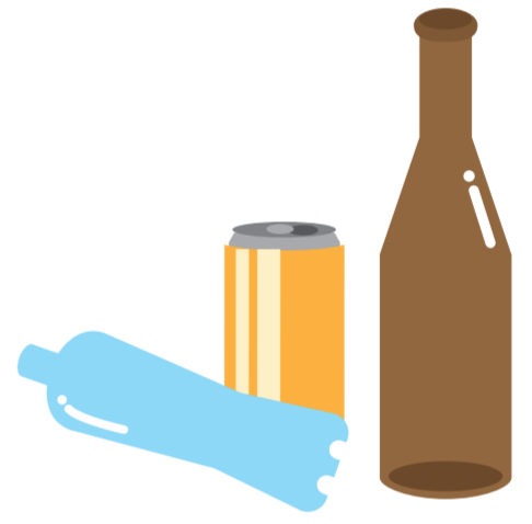
屋外に放置された空きビン・缶・ペットボトル