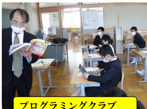
プログラミングクラブ